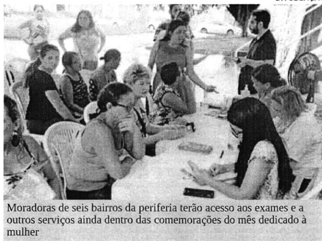
Moradoras de seis bairros da periferia terão acesso aos exames e a outros serviços ainda dentro das comemorações do mês dedicado à mulher

A Carreta da Mulher oferece exames de Papanicolau (preventivo feminino), mamografias, aferição de pressão arterial e glicemia, conduzidos por médicos, enfermeiros e técnicos, além de atendimento psicológico e assistência social. Pesquisas apontam que cerca