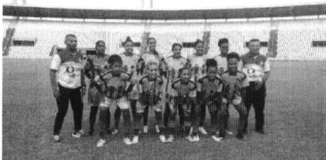
Time do Santa Quitéria que jogou ontem, pelo Campeonato Brasileiro Feminino